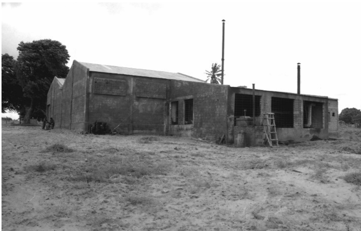
Fotografia 1. Vista geral do pavilhão principal da fábrica

Esta fábrica, cujo sistema produtivo conjuga mão-de-obra intensiva com artefactos mecânicos simples, é uma expressão concreta, como veremos mais à frente, das mudanças técnicas verificadas com a recomposição da indústria do caju nos anos 90. Como em muitas fábricas instaladas nesta década em Moçambique, o projecto seguiu de perto as propostas do Banco Mundial (BM), da Food and Agriculture Organisation (FAO) e de outras instituições internacionais com trabalho feito na área do caju. A localização está de acordo com o prescrito: uma fábrica inserida na zona produtora, de modo a que a distância entre os produtores e as instalações de processamento fosse a mais curta possível. Para além dos custos de transporte serem insignificantes, a proximidade dos produtores de castanha de caju facilita a aquisição da matéria-prima. A nível técnico optou-se pelo Steam Heating Cutting System (SHCS), o chamado sistema indiano baseado no cozimento da castanha por vapor de água em associação com o corte da casca através de máquinas semi-mecânicas.